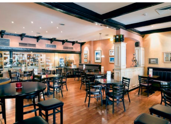
Nach einem anstrengenden Seminar- oder Tagungstag ist die Bar im Holiday Inn Wolfsburg oft gut besucht.