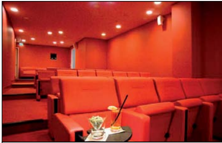
Raum für besondere Abende: Hoteleigenes Auditorium

Für Entertainment in dem umgebauten historischen Gebäude sorgt ein Auditorium mit 55 Sitzplätzen, das für einen entspannten Kinoabend oder für Vorträge gemietet