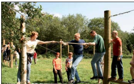
Gruppenevent: Niedrigseilgarten im Outdoorcenter

Der großzügige Tagungsbereich besteht aus sechs hellen Tagungsräumen, in denen maximal 250 Personen konferieren können. Alle Räume verfügen über Tageslicht, LAN, W-LAN, Telefon, TV, Beamer, Tageslichtprojektoren, Leinwand sowie moderne Moderationstechnik.