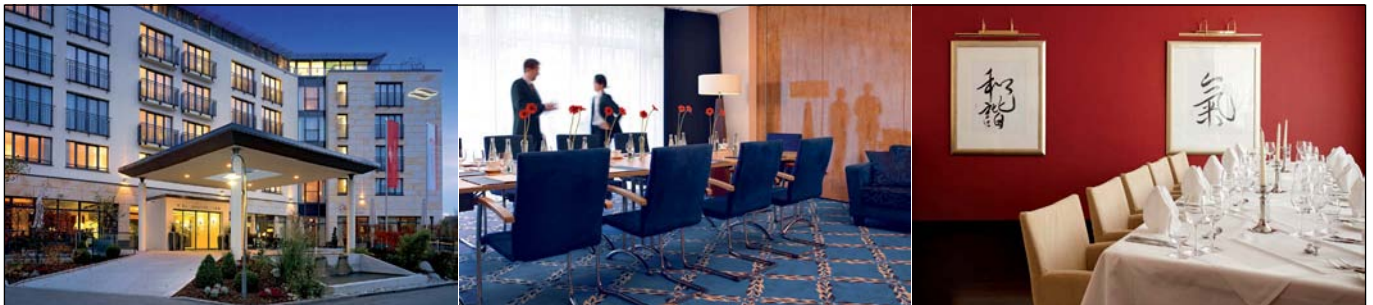
Hier passt alles zusammen: Außenansicht, Tagungsraum und Restaurant „Oliv's“ im Hotel Vier Jahreszeiten Starnberg

Das elegante Vier-Sterne Superior Hotel Vier Jahreszeiten Starnberg befindet sich in unmittelbarer Nähe zum Starnberger See in einer der schönsten Regionen Bayerns – zwischen München und den Alpen. Über die Autobahn A95 und eine direkte S-Bahn Anbindung gelangt man in nur 20 Minuten nach München. Neben einem in der Region einzigartigen und perfekt ausgestatteten Tagungsbereich überzeugt das privat und mit großem Engagement geführte Hotel mit der Planung und Umsetzung motivierender Incentives und aufregenden Teambuildings.