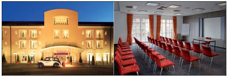
Professionell und abwechslungsreich: Das Maximilian Quellness- und Golfhotel

Das von bayerischer Eleganz geprägte Hotel verfügt über einen hoch professionellen Tagungsbereich, der die Herzen von Veranstaltungsorganisatoren höher schlagen lässt: 15 multifunktionale Tagungs- und Gruppenräume mit Kapazitäten von bis zu 140 Personen und der neu gestaltete Kursaal für maximal 450 Personen bieten alle Möglichkeiten für eine gelungene Umsetzung verschiedener Veranstaltungen. Darüber hinaus haben alle Räume Zugang ins Freie und Tageslicht.