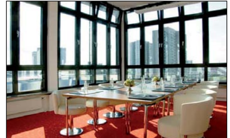
Atemberaubender Blick: Executive-Tagungsraum „Penthouse“

Ausführliche Informationen über das Park Plaza Wallstreet Berlin finden Sie in der umfangreichen Präsentation dieses außergewöhnlichen Businesshotels unter