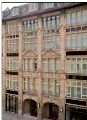
Modernes Hotel in historischem Gebäude: Das Park Plaza Wallstreet Berlin

Das Park Plaza Wallstreet ist ein Vier-Sterne-Luxushotel im Herzen des historischen Berlins – im Bezirk Mitte. Die praktische Lage unweit des Messegeländes und Kongresszentrums – gegenüber den beiden U-Bahn-Stationen Spittelmarkt und Märkisches Museum – ermöglicht eine direkte Anbindung an den Flughafen. Beliebte Sehenswürdigkeiten wie der Alexanderplatz, der Berliner Dom, die Museumsinsel, der Reichstag, das Brandenburger Tor und die Friedrichstraße sind bequem zu Fuß zu erreichen. Entsprechend der Philosophie der Park Plaza Hotels Europe, jedem einzelnen Haus durch eine bestimmte künstlerische Richtung ein individuelles Gesicht zu verleihen, wurde für dieses Haus das Leitmotiv Börse gewählt.