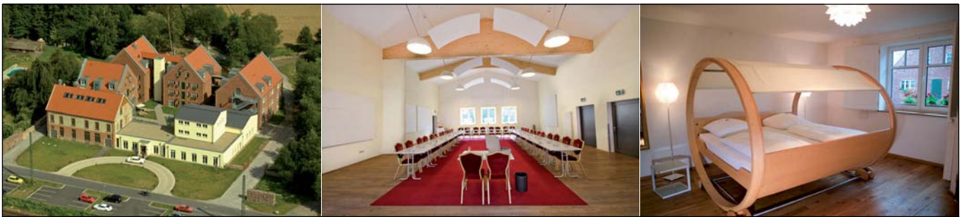
Typisch westfälisch mit professioneller und außergewöhnlicher Ausstattung: Das Landhotel Beverland

Eingebettet in die idyllische münsterländische Parklandschaft zwischen Ems und Bever liegt das Tagungshotel Landhotel Beverland. Trotz seiner Lage im Grünen verfügt das Vier-Sterne Hotel über eine ausgezeichnete Verkehrsanbindung: In nur wenigen Minuten erreicht man den Flughafen Münster-Osnabrück und die Autobahn A1 Köln-Bremen. Ein Teil des Hotels ist eine Industrieruine, die wieder zum Leben erweckt wurde. Das alte Backsteingebäude – übrig geblieben von der ehemaligen Molkereizentrale Ostbevern – steht in einem harmonischen Zusammenspiel mit den modernen Baukörpern.