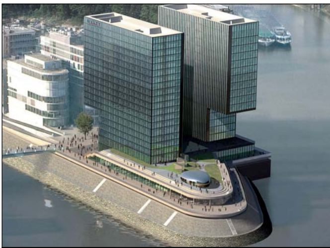
Exklusive Lage: Das Hyatt Regency Düsseldorf im Szeneviertel Medienhafen

Elegantes Design, modernste technische Ausstattung, ausgezeichnetes Catering und persönlicher Service zeichnen das Tagungsangebot des Hyatt Regency Düsseldorf aus. Auf rund 850 qm bietet das neue Hyatt-Haus Platz für Veranstaltungen unterschiedlicher Art. Seine exklusive Lage inmitten des Szeneviertels Medienhafen mit gutem Anschluss an den internationalen Flughafen Düsseldorf, die Innenstadt und die wichtigsten Messe- und Kongresszentren macht das Hotel für Geschäftsreisende und Tagungsveranstalter zu einer der ersten Adressen am Platz.